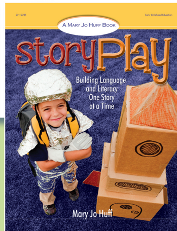
10701 / $16.95 PB